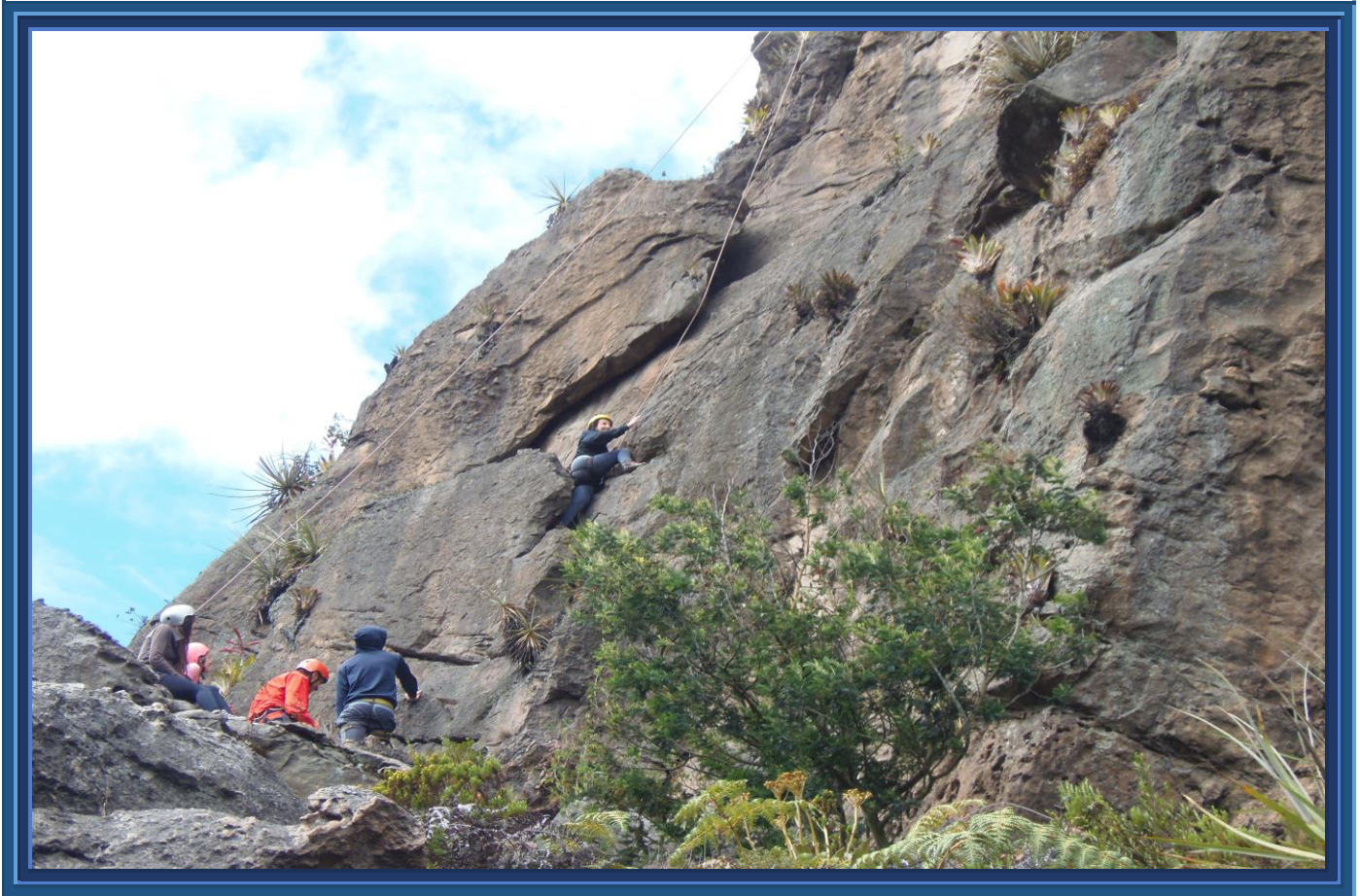
Escalada en Roca en los farallones de Sutatausa.