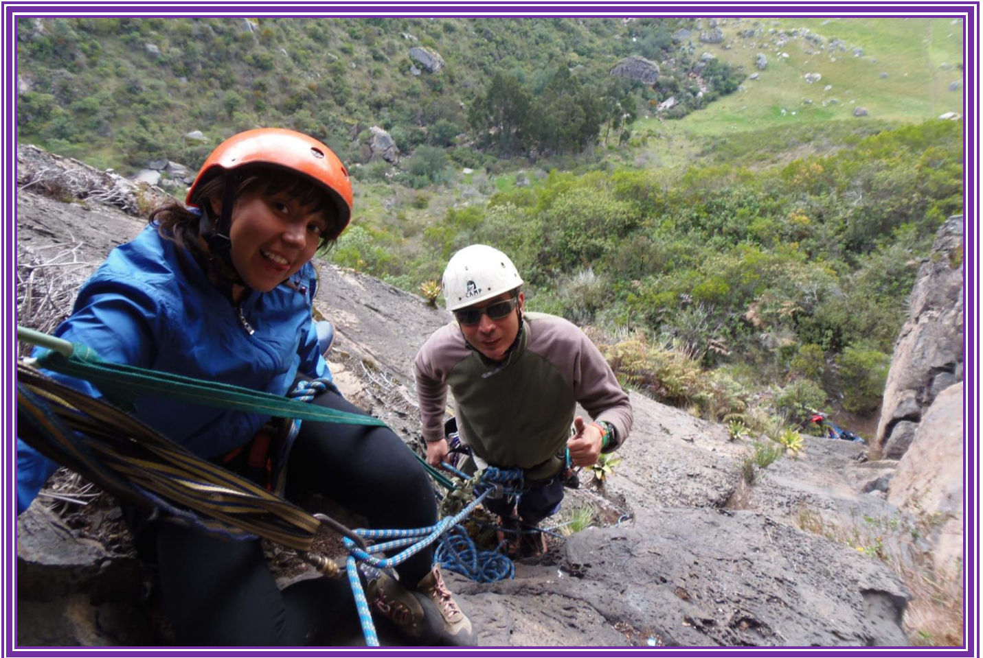
Escalada en Roca en los farallones de Sutatausa.

Nota: precios especiales para grupos. Se puede contratar la alimentación y el transporte.