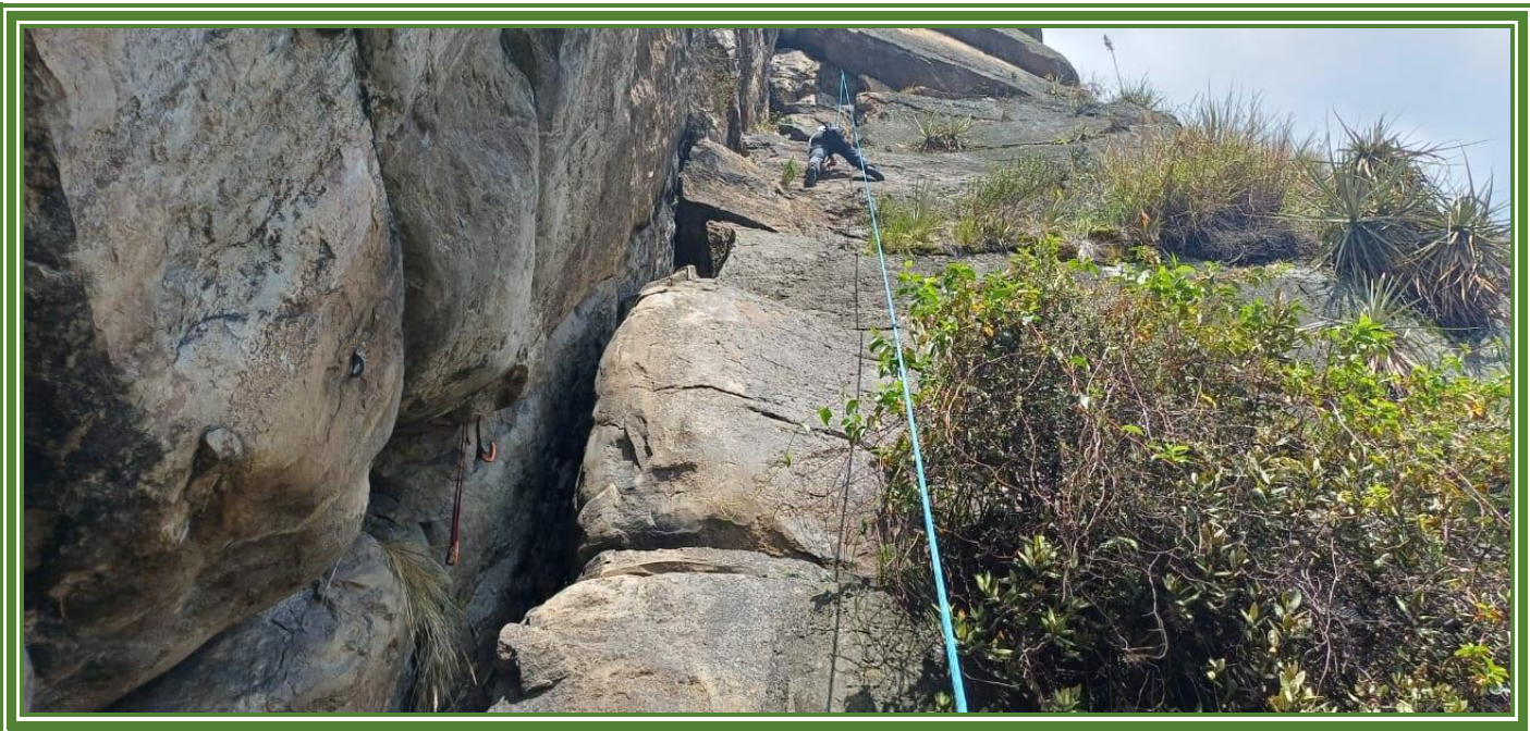
Escalada en Roca en los farallones de Sutatausa.